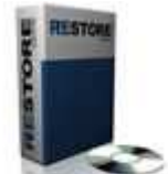
RESTORE RESTORE Live 4.0.9-1 (1 CD)