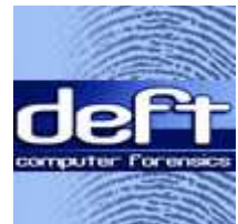
deft DEFT Linux 3.0 - Forensic Linux