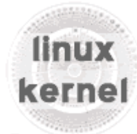
linux kernel Linux Kernel 2.6.24 + Tutorial (1 CD)