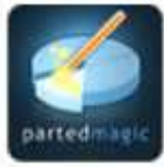
partedmagic Parted Magic 2.0 (1 CD)