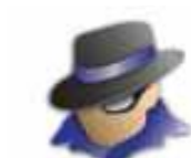
StartCom StartCom Enterprise Linux 5 - i386 (1 DVD)