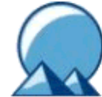
MEPIS SimplyMEPIS 7.0 (1 CD)