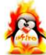
IPFire IPFire 2.1 Final (1 CD)