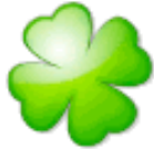
SLAX Slax 6.0.0 For USB (1 CD)