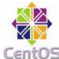
CentOS CentOS 5.0 - i386 (1 DVD)