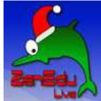
ZenEdu Live ZenEdu Live Christmas Edition (1 CD)