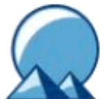
MEPIS MEPIS antiX 7.01 (1 CD)