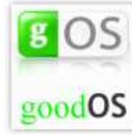
goodOS gOS Rocket Live 2.0.0 i386 (1 CD)