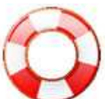
Super Grub Disk MBR RECOVERY Super Grub Disk 0.9673 Live MBR Recovery (1 CD)