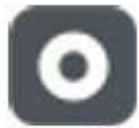
openfiler Openfiler 2.2 x86 (respin 2) (1 CD)