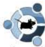
xubuntu Xubuntu 7.10 Desktop i386 (1 CD)